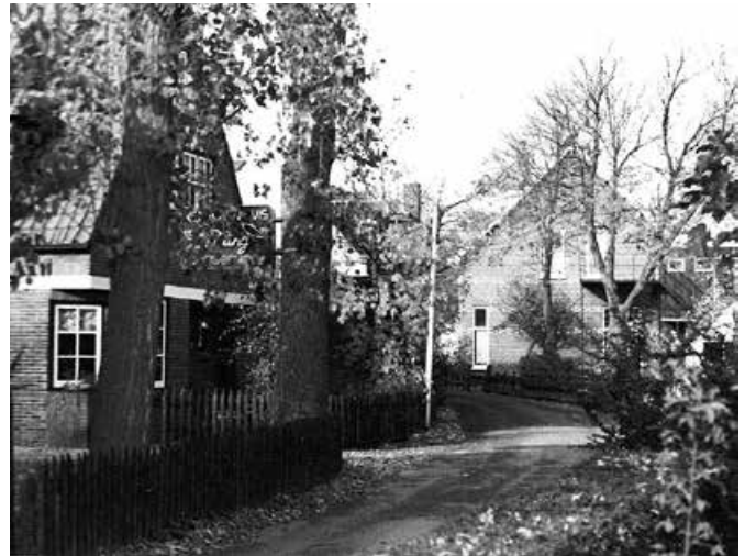
Situatie rond 1960 met links het woonhuis 'Sunny home'.