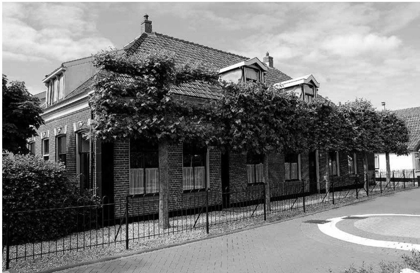
De huidige voorzijde