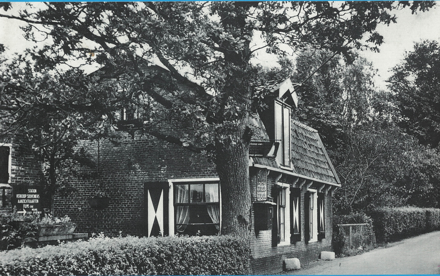
Oude Poststation op de Kaag

NUMMER 119 - JAARGANG 29 - SEPTEMBER 2012 KWARTAALUITGAVE STICHTING OUD ALKEMADE