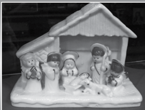
Eén van de vele bijzondere kerstgroepjes.