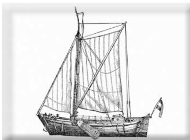
Model van een kaagschuyt