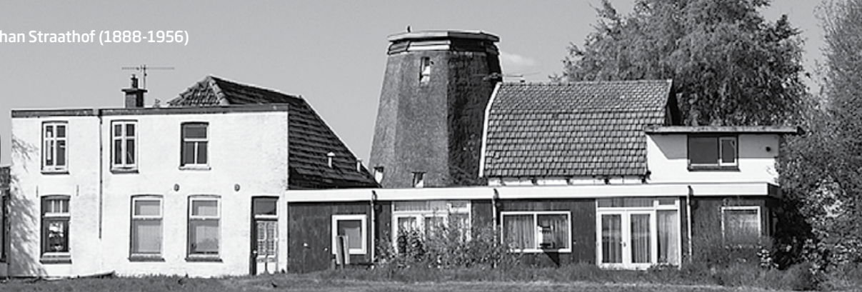
Een onlangs gemaakte foto van de huisjes met de molen erachter.