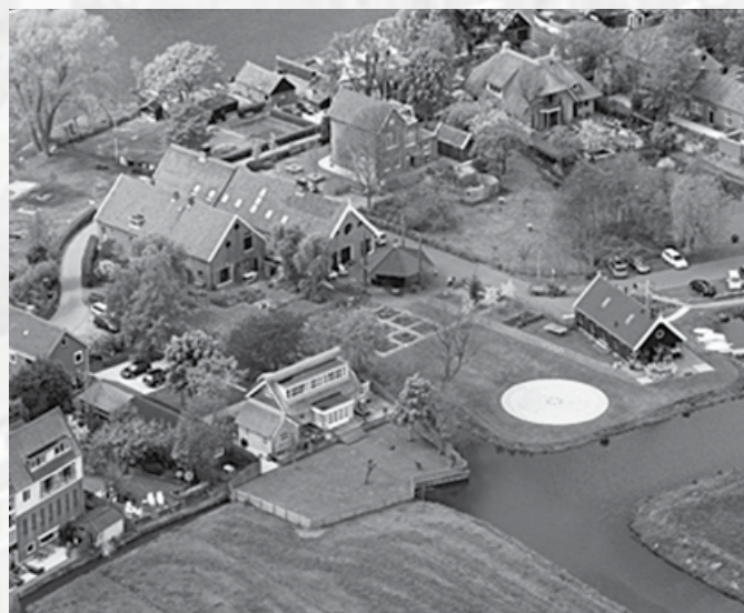
De Stal op de Kaag vanuit de lucht

Na de pauze zal Gert Wentzel zijn boek over de bekende