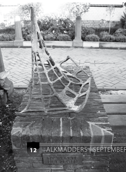
Het monument met de plaquette 'Hij werkte met zegen'.