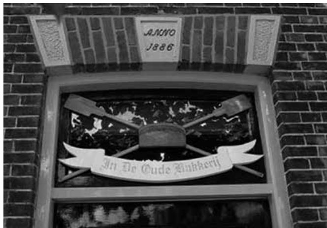
De naam boven de voordeur