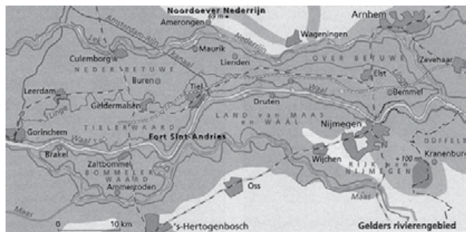
Kaartje van het Gelders rivierengebied

Vrachtauto's uit Kaag en Braassem rijden tegenwoordig door heel Europa, maar ook in de 17e eeuw legden inwoners van de Kaag met hun schepen al grote afstanden af. In het boek 'De tegenwoordige staat der Verenigde Nederlanden' uit 1746 wordt over de Kaag geschreven dat de bewoners op de Waal en op de Rijn varen, zelfs tot Wesel, en op de Maas, tot voorbij Grave, Venlo (overslag) en Roermond. Bron voor deze informatie is de Gelderse Rekenkamer. Daar werden de tolrekeningen gecontroleerd van de Grote Gelders Tollen die op de rivieren ten behoeve van het Gewest Gelre werden geheven.