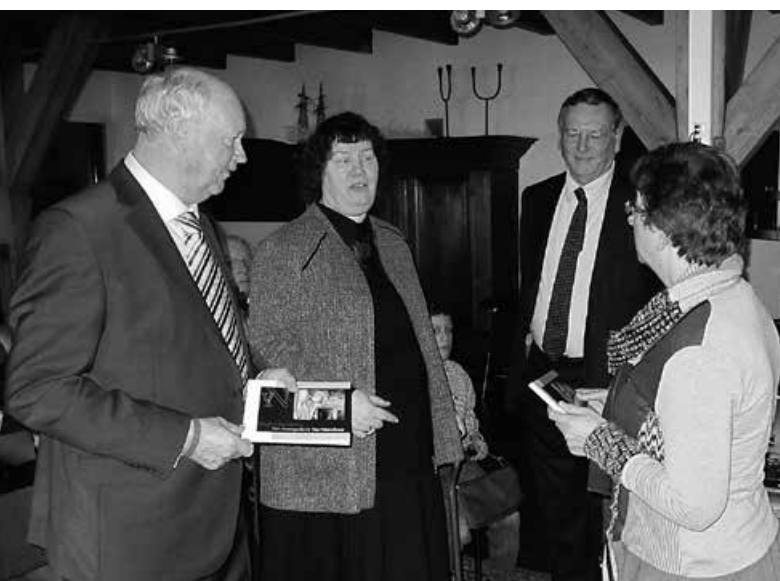
Het afscheid van de heer en mevrouw van Nieuwkoop