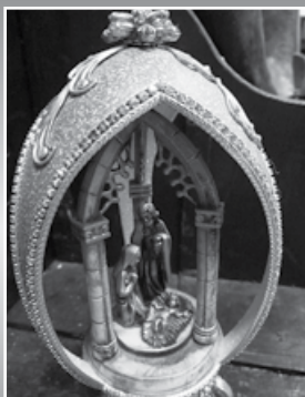
Het emoe-ei van Ans Koek.

Op zondagmiddag 30 september vanaf 14.00 uur is Elly Heemskerk van Keramiek atelier De Schuur in het museum aanwezig met de nodige materialen om een kerstgroep te boetseren. Bezoekers die het leuk vinden om met klei te werken, kunnen meedoen aan een mini-workshop van een half uur. Je hoeft geen ervaring te hebben met boetseren om toch iets moois te kunnen maken. De kerststal zal uiteindelijk verloot worden onder de deelnemers!