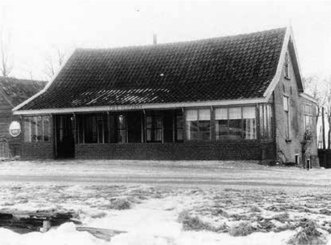
Café 'Ruimzicht' aan de Huigsloterdijk 167. Rechts was oorspronkelijk het winkeltje, links is de bovenschuur. De foto is van omstreeks 1955.

Hoewel café 'Ruimzicht' niet in de voormalige gemeente Alkemade stond, hoort het toch in zekere zin bij de Nieuwe Wetering. Veel Nieuwe Weteringers zullen hier wel eens een biertje of een borreltje hebben gedronken.