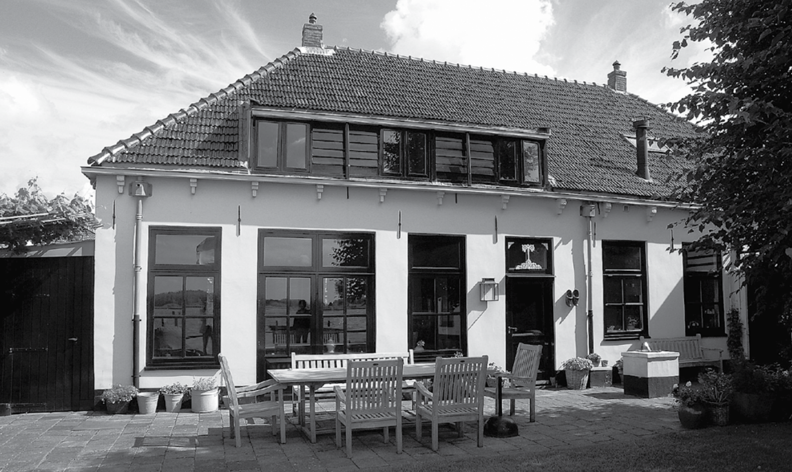
De achterzijde van de woning in de huidige staat

gaan, maar in de vakanties deden ze ook niet veel aan het huis. Die tijd was er voor de kinderen en de vele vriendjes die kwamen spelen. Ook hebben ze jarenlang gefungeerd als vakantiepleeggezin in samenwerking met de Raad voor de Kinderbescherming.